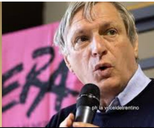
Don Luigi Ciotti